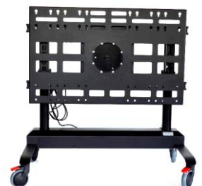
Display Mobil 5010 L mit Option T